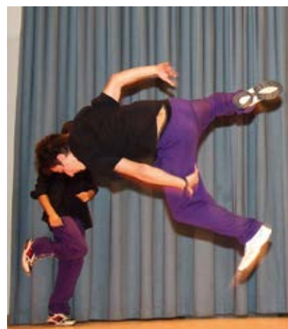
Die Gruppe Style Fly beim BZ-Tag der Sportunion Osttirol.

Gehrt wurden folgende Funktionäre, Helfer und Sportler: