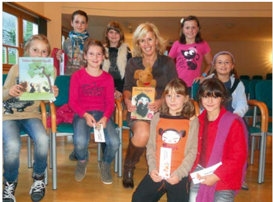
Gaimberger Volksschulkinder mit der Autorin.

Das Team der Bücherei wünscht euch ein frohes und gesegnetes Weihnachtsfest sowie ein erfolgreiches Neues Jahr und freut sich auch 2013 auf die Begegnung mit vielen großen und kleinen Lesefreunden.