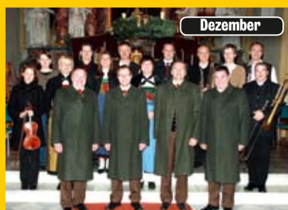
Adventsingen in der Pfarrkirche Oberlienz