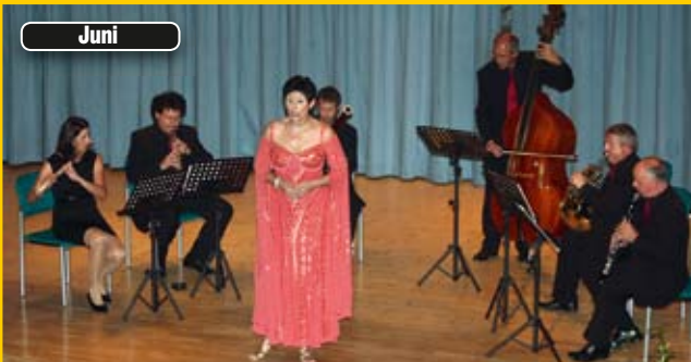
Ensemble Capella im Gemeindezentrum