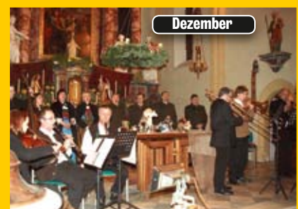
Adventsingen in der Pfarrkirche Oberlienz