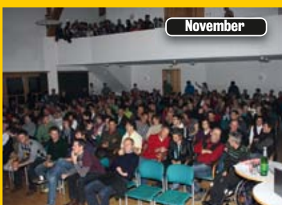
Vortrag „Hoch Tirol“ im Gemeindezentrum