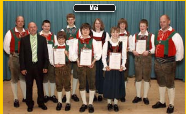
Überreichung der Leistungsabzeichen an die Jungmusikanten beim Frühjahrskonzert der MK Oberlienz