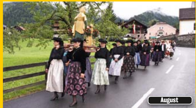
Kirchtag in Oberlienz