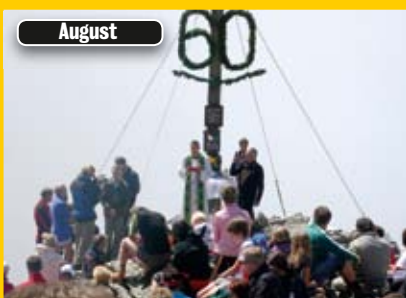
60 Jahre Schleinitzkreuz