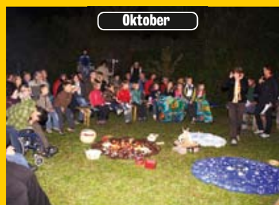
Sagenhafter Abend bei der Wollkartatsche