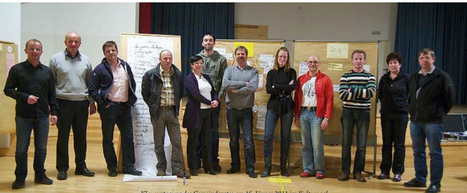
Klausurtagung des Gemeinderates am 15. Jänner 2011 im Kultursaal.

Sämtliche Daten (Bevölkerung, Wohnbau, Wirtschaft, etc.) müssen aktualisiert und zwischenzeitliche Baulandkonsumierungen erfasst und eine aktuelle Baulandbilanz erstellt werden.