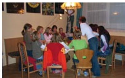
Kürbis & Co