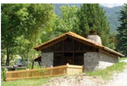
Huf- und Beschlagschmiede

Im heurigen Jahr erfolgten in der Gemeinde Oberlienz wieder mehrere Beiträge zur Verschönerung und Wiederbelebung des Ortsbildes. Alte Kultur- und Brauchtumsobjekte die keinen unmittelbaren wirtschaftlichen Nutzen bringen drohen oft dem Verfall preisgegeben zu werden. Das Projekt Freilichtmuseum war ein Beitrag dem entgegenzuwirken. Bereits im Jahr 2007 war die Neueindeckung der drei Objekte „Huf- und Beschlagschmiede“, „Znoppmühle“ und „Wollkartatsche“ mittels Lärchenschindeln erfolgt.