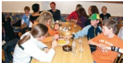
Allgemeine Stärkung nach dem Kegeln im Kegelstadel