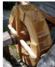
Glanz Mühle / Wasserrad der Wollkartatsche

Im Laufe des heurigen Jahres wurde das Projekt weiterbetrieben beziehungsweise erweitert. Die Glanz Mühle wurde in das Projekt mit einbezogen und sie erhielt einen neuen Holzaufbau mit Dach und Schindeldeckung. Bei den Objekten mit Wasserrad wurde auch dieses erneuert. Ein neues Dach aus Lärchenschindeln erhielt auch der Heigl Kornkasten.