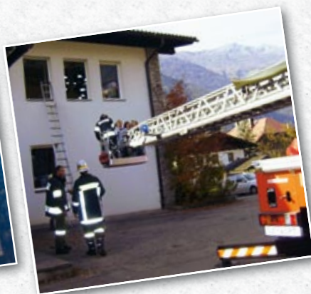
Einsatztruppe bei der Bergeübung