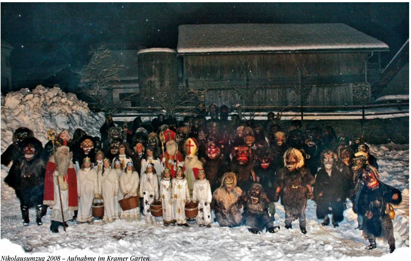
Nikolausumzug 2008 – Aufnahme im Kramer Garten.