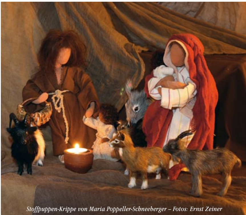
Stoffpuppen-Krippe von Maria Poppeller-Schneeberger

Für das Chronikteam Oberlienz Gottfried Stotter u. Ernst Zeiner Tel. 04852 69083 email: gottfried.st@inode.at