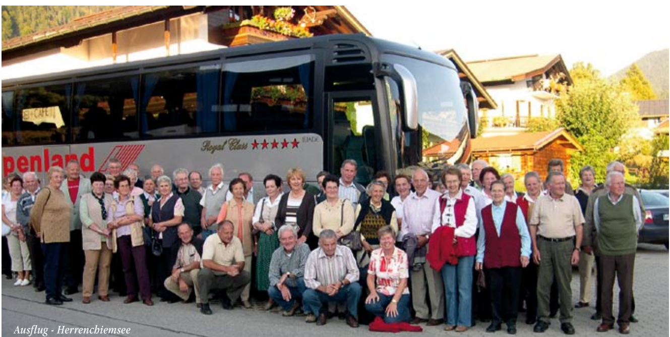
Ausflug - Herrenchiemsee

Mit Tanz und Unterhaltung nahm die Veranstaltung ihren Lauf und endete um Mitternacht. Toni Steidl