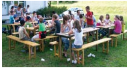
Abschlussgrillen bei der Volksschule