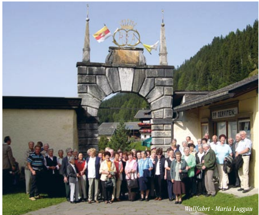
Wallfahrt - Maria Luggau