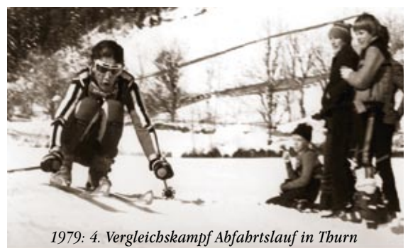
1979: 4. Vergleichskampf Abfahrtslauf in Thurn

So sehr der sportliche Ehrgeiz vieler Rennläufer und Funktionäre zu würdigen ist, ist es doch dadurch immer schwieriger geworden den ambitionierten Durchschnittsfahrer, eben die breite Masse für eine Teilnahme zu diesem sportlichen Wettbewerb zu motivieren. Gerade der Jubiläumswettkampf zum dreißigjährigen Bestehen könnte daher Anlass sein, darüber nachzudenken, wie der Vergleichskampf sowohl sportlich als auch gesellschaftlich noch an Attraktivität gewinnen kann. Zum Beispiel mit einer eigenen Teamwertung für Vereine der einzelnen Gemeinden – von der Musikkapelle, den Feuerwehren bis zu den Gemischten Turnern – könnten sich sowohl Vereinsmannschaften innerhalb der eigenen Gemeinde, als auch gleichartige Vereine der einzelnen Gemeinden sportlich messen. Es wäre sicherlich eine neue Herausforderung für viele von uns durch einen gesunden sportlichen Ehrgeiz und ebensolches Interesse an guten Beziehungen zu den Nachbardörfern Thurn und Gaimberg diesen jährlichen Wett-