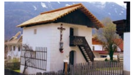
Heigl Kornkasten mit neuem Lärchendach

Mit finanzieller Unterstützung der Dorferneuerung Tirol konnten auch die Kosten der Sanierung in Grenzen gehalten werden. In Osttirol nehmen derzeit 27 von 33 Gemeinden am Programm der Dorferneuerung teil.