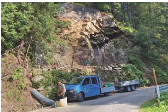
Juni 2022: Sanierung Mühlweg. Aufgrund vermehrter Steinschläge musste ein Bereich des Mühlweges saniert werden. Bestehendes Felsmaterial wurde abgeräumt und vernetzt, ein Steinschlagschutznetz wurde errichtet.