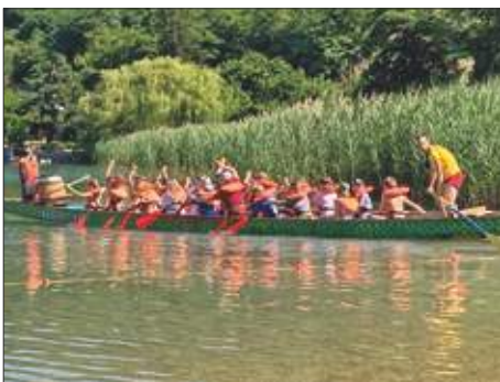
Mit dem Drachenboot einmal quer über den Caldonazzosee.