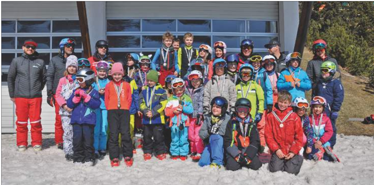
Das Bild zeigt die Teilnehmer der Volksschulen Thurn und St. Johann i.W. mit ihren Skilehrern.