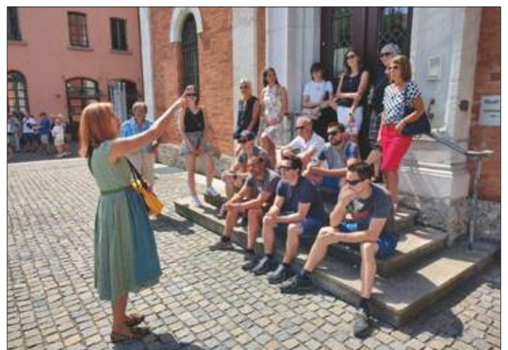
Auf den Spuren der Rosenheim Cops.