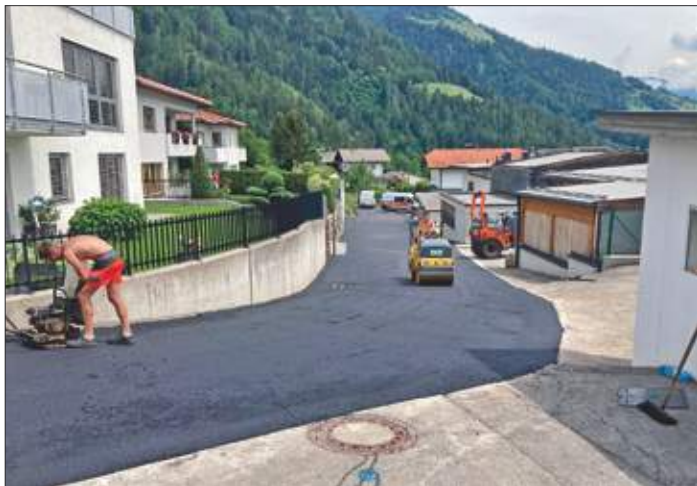
Mai 2022: Sanierung Weberlefeld. Die ursprüngliche Baulanderschließung Weberlefeld erfolgte im Jahr 2002. Bereits nach 20 Jahren mussten aufgrund mangelhafter Bauausführung Teile der Wasserleitung und die Asphaltdecke erneuert werden.