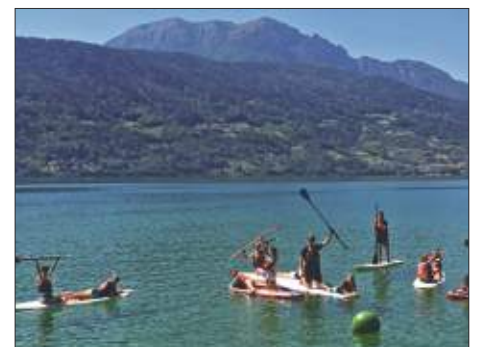
SUP = Stand Up Paddling.