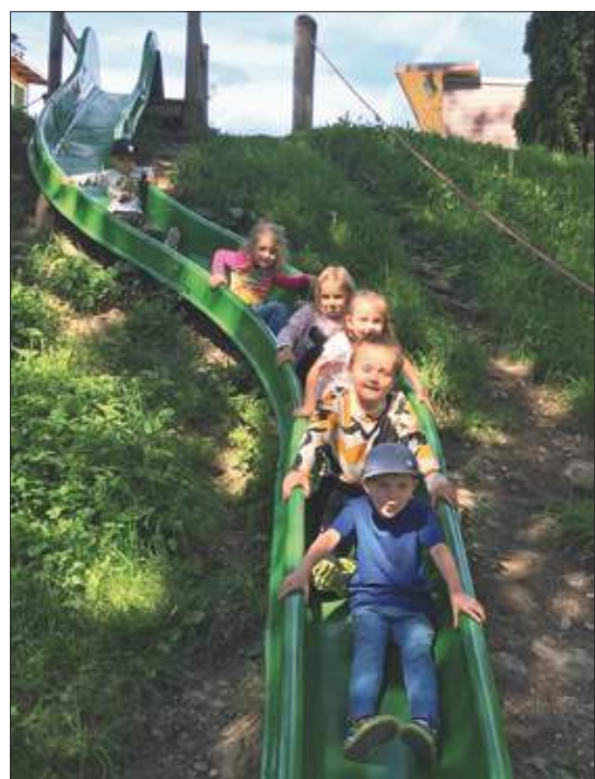
Juni 2022: Montage der neuen Rutsche am Spielplatz.