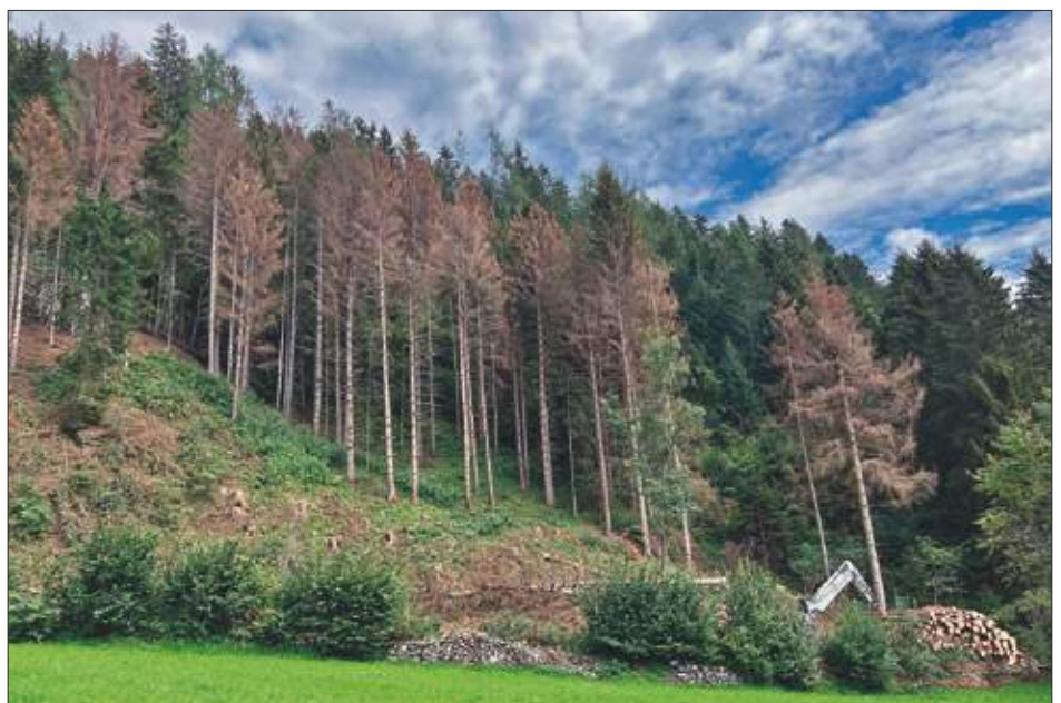
Borkenkäferbefall in der Prappernitze.