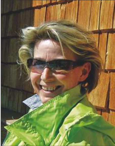
30.05.2004 am Zettersfeld, Mandlhütte