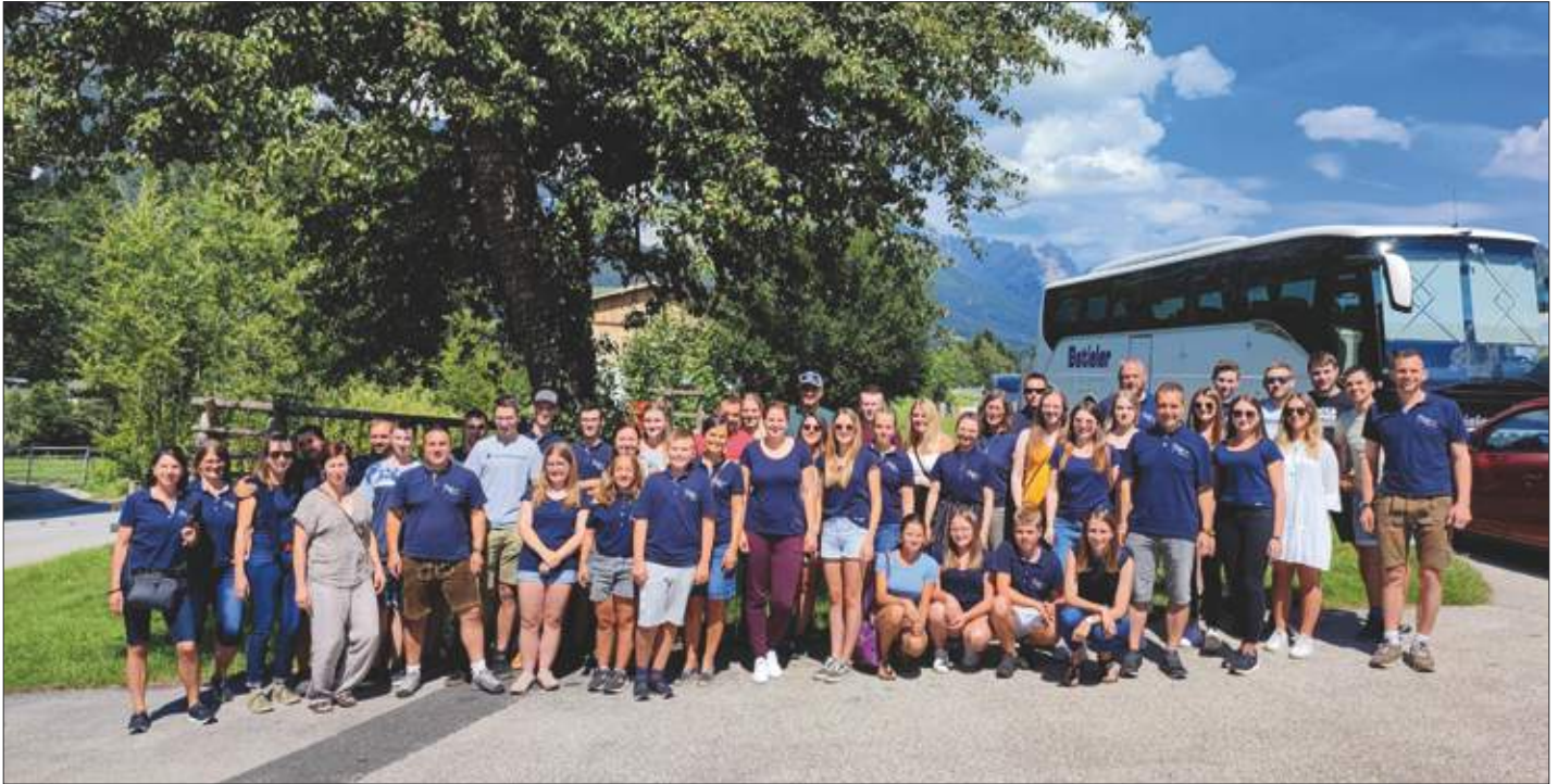
Die Musikkapelle Thurn unterwegs zum Längenfelder Musikfest.

Aufgrund des verregneten Wetters konnte das Bezirksmusikfest am 6. August in Lienz nicht wie gewohnt stattfinden. Leider wurden sowohl der Aufmarsch der Musikkapellen zum Johannesplatz als auch die Defilierung und die Konzerte am Hauptplatz abgesagt. Der Vorstand der Musikkapelle Thurn besuchte den Festgottesdienst mit den anschließenden Ehrungen in der Klosterkirche und vertrat somit unsere Musikkapelle.