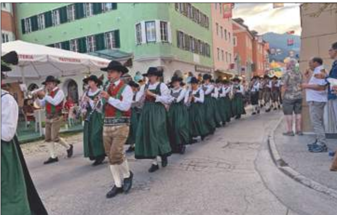
Aufmarsch von der Rosengasse zum Hauptplatz.

Der Juli war für uns sehr ereignisreich und anstrengend mit vielen Auftritten und Konzerten. Am Mittwoch, den 13. Juli, spielten wir am Hauptplatz das jährliche Platzkonzert. Beim Aufmarsch von der Rosengasse zum Hauptplatz präsentierten wir unser gesamtes Marschierprogramm mit Abfallen, großer Wende und Co. Anschließend konnten die Zuhörer an diesem lauen Sommerabend das abwechslungsreiche Programm der Musikkapelle Thurn genießen.