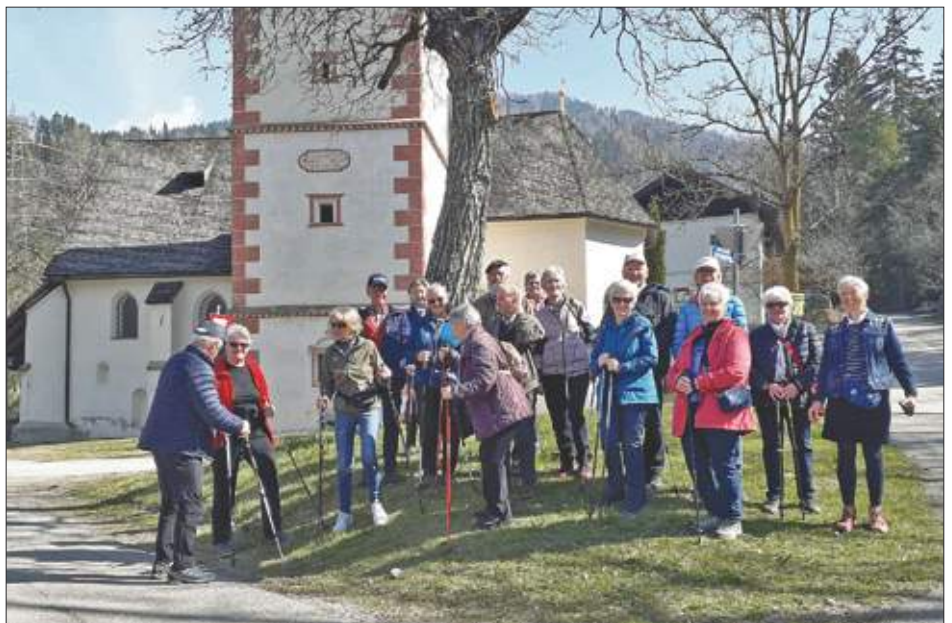
Vor der Kirche St. Georg in Gödnach.