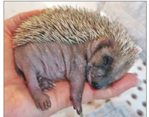
Jungigel in Auffangstation.