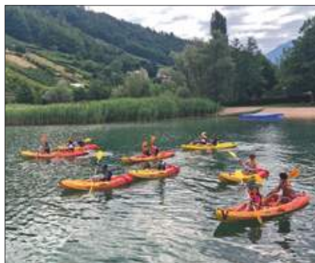
Kanufahren im See.