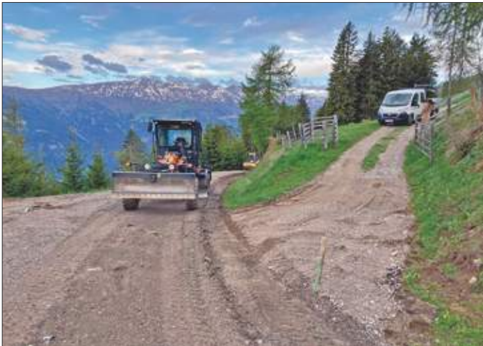
Mai 2022: Sanierung Zettersfeldstraße. Das Teilstück der Zettersfeldstraße zwischen Einfahrt Niggler Alm und Mußhauserkehre wurde generalsaniert und neu asphaltiert.