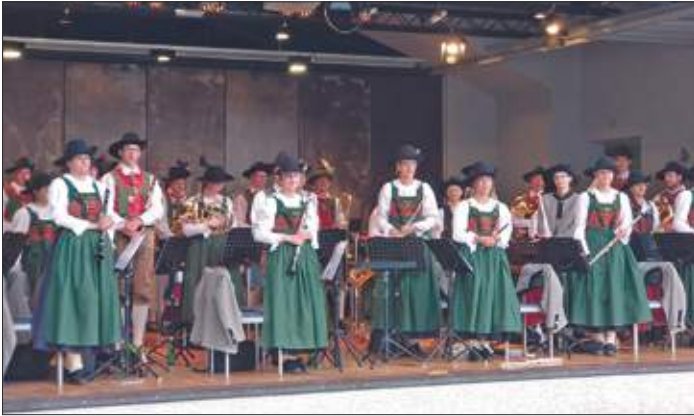
Die Musikkapelle Thurn konzertierte am 10. Juli in Anras.

Von 2. bis 10. Juli fanden die „Anraser Musiktage“ statt. In dieser Zeit konzertierten dort herausragende Musikkapellen, wie Pfeffersberg aus Südtirol und „German Brass“. So war es für uns eine große Ehre, ein Teil dieser Veranstaltung sein zu dürfen.