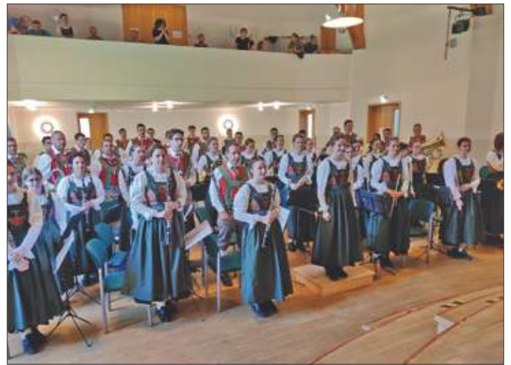
Die Musikkapelle Thurn erspielte sich beim Wertungsspiel in Oberlienz eine 1. Preis-Goldmedaille sowie den Gruppensieg in der Stufe B.