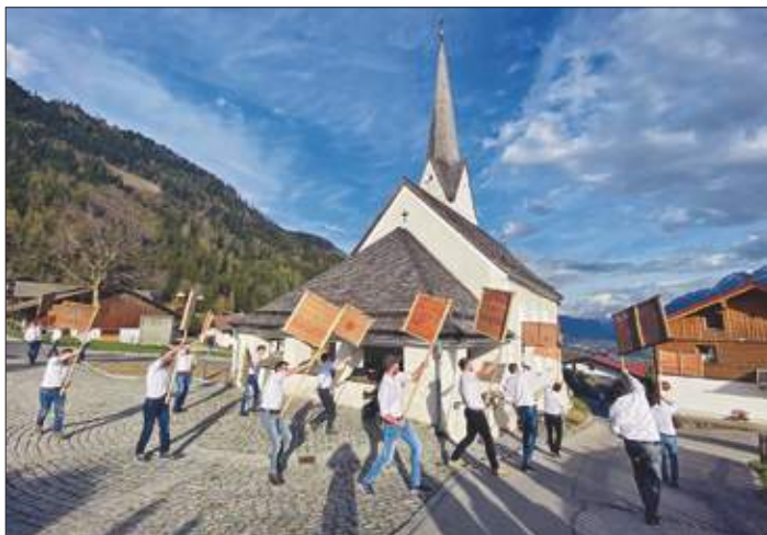
Ratschen um die Kirche vor der Abendliturgie am Karfreitag.

Vor der Abendliturgie am Freitag teilten sich die Ratscher wieder in den einzelnen Ortsteilen auf und kamen schließlich für die Heilige Messe bei der Kirche zusammen. Am Karsamstagvormittag präsentierten wir unsere Ratschen auf dem Stadtmarkt, bevor es zur Auferstehungsmesse auf St. Helena ging. Dort verteilten wir an alle Kirchgänger insgesamt 1.500 geweihte Brote, welche von den Männern mit Körben hinaufgetragen wurden. Im Anschluss wurden beim Ausschankwagen hinterm Soga noch fleißig Eier gepeckt.